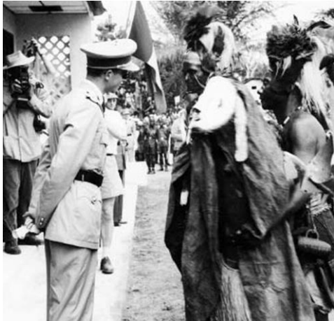
Koning Boudewijn in Belgisch Kongo.

De kolonisatie van Afrika bleef lange tijd beperkt tot het oprichten van handelsposten in de kuststreken. Toen er verder geen andere gebieden meer te veroveren waren, viel ook het Afrikaanse continent ten prooi aan de kolonisatiedrang van de Europese grootmachten. Eind 19e eeuw kwamen de koloniale mogendheden samen op de Conferentie van Berlijn (1884-1885) om Afrika onderling te verdelen. Ook de Belgische koning wist er een kolonie te verwerven. Kongo-Vrijstaat, een land tachtig keer zo groot als België, werd als persoonlijk bezit aan Leopold II toegewezen. Na toenemende beschuldigingen van wanbeheer werd het gebied in 1908 door de Belgische staat overgenomen als nationale kolonie. In de volgende decennia trokken vele Belgen naar Kongo om daar het land te helpen besturen of nieuwe bedrijven op te richten. Tegen het einde van de koloniale periode hadden naar schatting 80 000 Belgische burgers zich in Kongo gevestigd. Door het gespannen klimaat na de onafhankelijkheid van Kongo in 1960 keerden de meeste Belgen uiteindelijk naar huis terug.