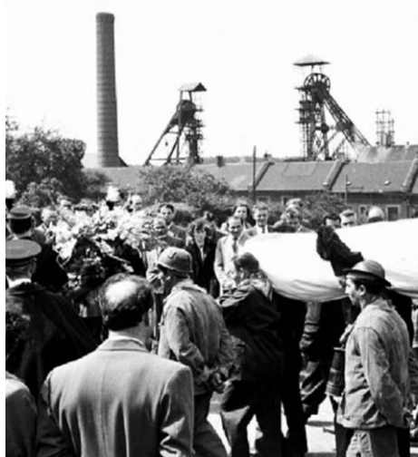
Bij een ongeval in de mijn van Marcinelle kwamen honderden gastarbeiders om het leven.

Na de bevrijding werden Duitse krijgsgevangenen tewerkgesteld in onze steenkoolmijnen om de Poolse en Russische gevangenen te vervangen die intussen bevrijd waren. Sommige Duitsers zouden ook na de bevrijding van alle buitenlandse gevangenen in België blijven om een nieuw leven op te bouwen. De gevangenen die vertrokken dienden vervangen te worden door 'flexibele en weinig veeleisende arbeidskrachten'. Op 20 juni 1946 sloot de Belgische regering een overeenkomst met Italië over de komst van 50.000 Italiaanse werkkrachten. Voor elke migrant kreeg de Italiaanse regering een bepaalde hoeveelheid