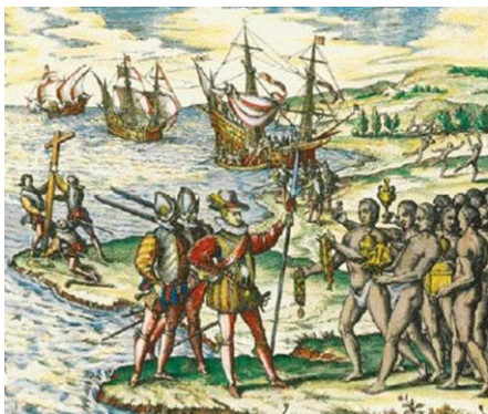
Columbus komt aan in Indië.

Geconfronteerd met het succes van de Portugezen, konden hun Spaanse concurrenten niet achterblijven. Na lang aandringen kreeg Christoffel Columbus in 1492 de goedkeuring – en het geld – van de Spaanse koning om zijn plan te realiseren om via het westen naar India te varen. Uiteindelijk raakte hij op de Bahama-eilanden verzeild, maar dat weerhield er hem niet van om de lokale bevolking ‘indianen’ te dopen. Hoewel Columbus vaak als ontdekker van Amerika wordt genoemd, was het uiteindelijk een andere Italiaan, Giovanni Caboto, die weliswaar in Engelse dienst, als eerste voet aan wal zette op het Amerikaanse continent in 1497. De Spanjaarden waren er aan het begin van de 16 e eeuw wel in geslaagd een westelijke doorgang te vinden, helemaal rond Zuid-Amerika. Een van de schepen die in 1519 onder leiding van de Portugees Ferdinand Magellaan uit Spanje was vertrokken, keerde in 1522 terug van een tocht rond de wereld, langs Patagonië en de Filippijnen en helemaal rond Afrika terug naar Sevilla.