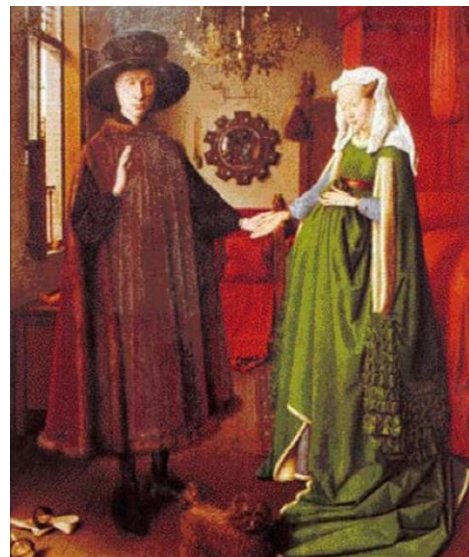
Het Arnolfini-huwelijk van Van Eyck stelt rijke Italiaanse migranten voor.

werden georganiseerd in o.a. Brugge en Ieper, vonden handelaars uit de rest van Europa hun weg naar onze contreien. Terwijl de inwoners hier konden genieten van de Engelse, Franse en Italiaanse producten die werden geïmporteerd, werd het Vlaamse laken verspreid over de rest van het continent. Omdat Brugge en later ook Antwerpen in die tijd belangrijke economische centra waren, vestigden buitenlandse handelaars zich soms ook permanent in ons land. Een illustratie hiervan is het schilderij 'Het Arnolfini huwelijk' van Jan Van Eyck. Wat veel mensen niet weten is dat deze nochtans Vlaamse Primitief eigenlijk een koppel migranten afbeeldt. Het gaat namelijk om een portret van Giovanni Arnolfini, een rijke Italiaanse bankier die zich in Brugge vestigde, samen met zijn vrouw, Giovanna Cenami.