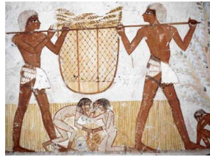
De eerste sedentaire semenlevingen waren waarschijnlijk in Egypte.

waarschijnlijk in Egypte, in de Indusvallei en in Mesopotamië.