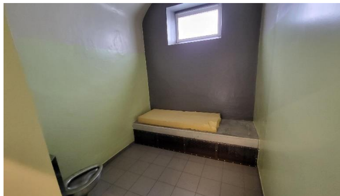
De straf-/beveiligde cellen