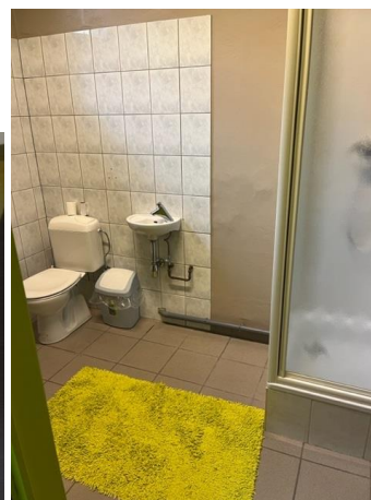
De ruimte voor ongestoord of familiaal bezoek met bijhorend sanitair