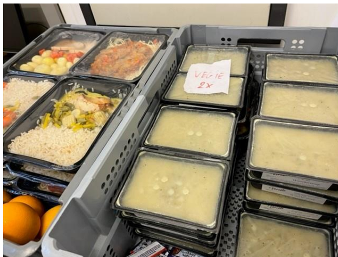
De extern aangeleverde maaltijden en soep

In de voormiddag gebeurt de bedeling van de diepvriesmaaltijden en de soep, om 17u volgt de bedeling van brood voor de avondmaaltijd en het ontbijt. Elke gedetineerde ontvangt op dat ogenblik een klein brood. Wat het beleg voor dit brood betreft, wordt verwezen naar de wekelijkse gratis bedeling van beleg (zoals chocopasta, chocolade en kaas), melk, suiker, boter en poffertjes. De gedetineerden geven over het algemeen aan tevreden te zijn over de broodmaaltijden en het hiervoor aangeboden beleg.