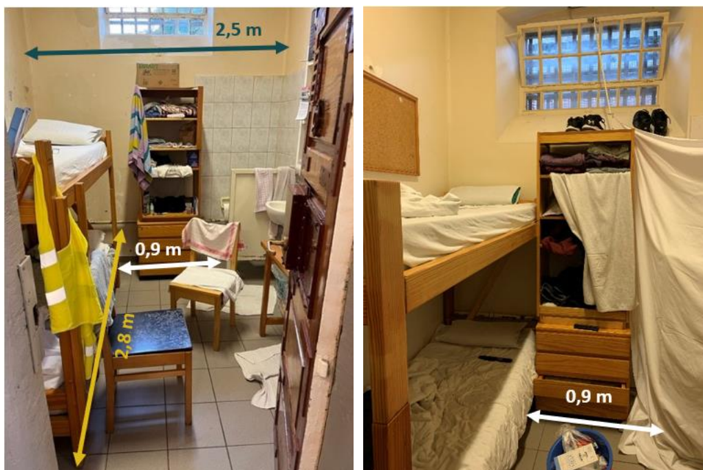
Enkele voorbeelden van cellen met hun afmetingen