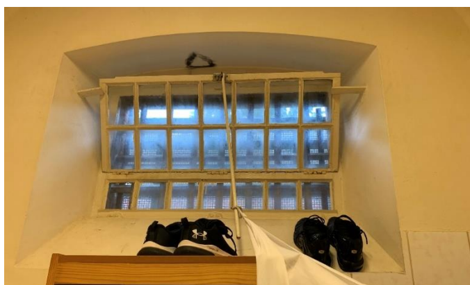
De celramen met beperkte lichtinval

In de cellen is de natuurlijke lichtinval eerder beperkt. De ramen hebben een oppervlakte van ongeveer 0,7 m 2 . Hiermee wordt niet voldaan aan de minimale vereiste van 1 m 2 zoals bepaald in het KB van 3 februari 2019. Door de aanwezigheid van tralies achter het raam is de natuurlijke lichtinval zodanig beperkt dat er bijkomend kunstlicht nodig is om, zelfs op een zonnige dag, overdag comfortabel te kunnen lezen.