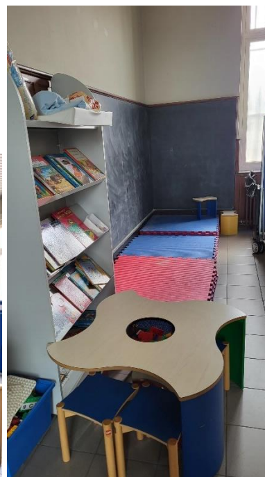
De bezoekszaal en de speelhoek

Gedurende de coronapandemie werden er in vele inrichtingen voorzieningen getroffen voor videobezoek, zo ook in Tongeren. Het grote succes van deze bezoekmodaliteit (zeker in het licht van de specifieke populatie in Tongeren) zorgde ervoor dat deze ook na de gezondheids crisis in stand werd gehouden. Gedetineerden die gebruik wensen te maken van videobezoek kunnen gedurende het bezoek plaatsnemen in een ruimte waar het penitentiair personeel het videogesprek voor hen klaarzet. Dit lokaal is voorzien van een tafel, een stoel en een pc. Het toetsenbord van de pc is afgedekt met een houten plaat die met een hangslot is vergrendeld gedurende het videogesprek.