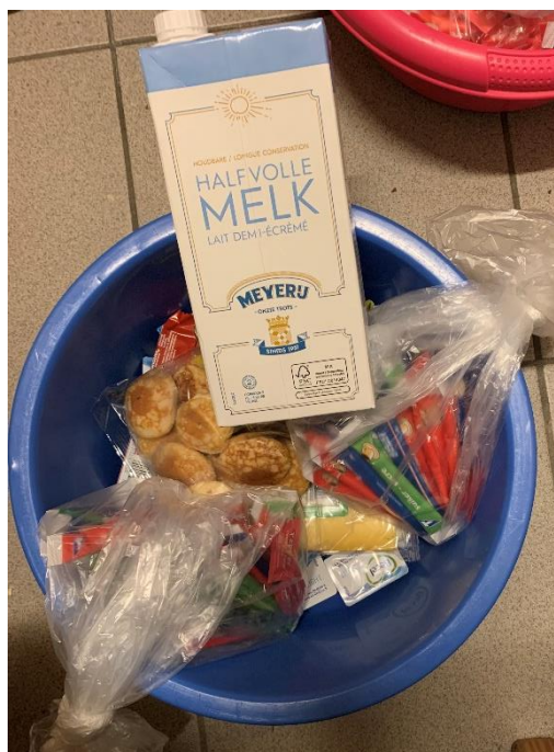
De wekelijkse, gratis bevoorrading

62. Naast de standaardmaaltijden en de wekelijkse bevoorrading met beleg, kunnen gedetineerden via de kantine bijkomende producten aanschaffen die zij wensen. Deze aankopen gebeuren voor eigen rekening, hetgeen de aankoop via de kantine bemoeilijkt voor gedetineerden die geen geld ontvangen van bijvoorbeeld hun familie buiten de inrichting.