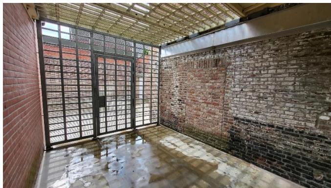
De individuele wandeling

mogelijkheid stelt om aan lichaamsbeweging te doen. De vraag rijst of de gedetineerden die individueel moeten wandelen, net zoals in de penitentiaire inrichting van Marneffe, geen gebruik kunnen maken van de gemeenschappelijke wandelplaats?