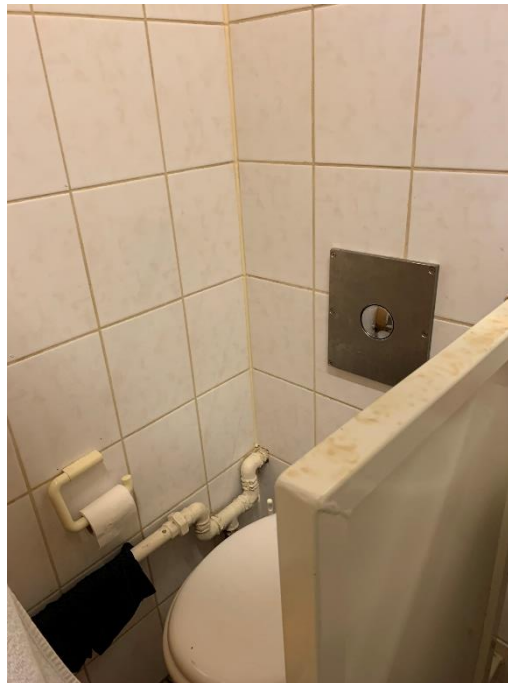
Het sanitair in de cellen, vlak naast het bed