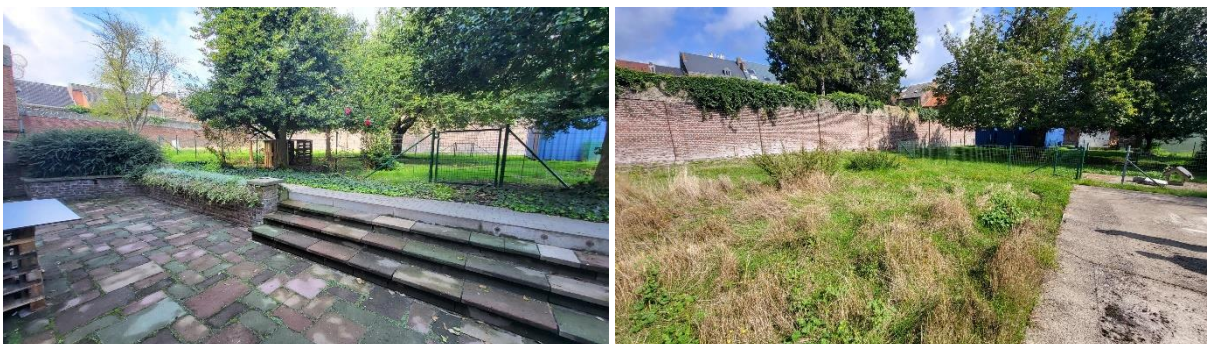
De ongebruikte buitenruimte

49. De delegatie stelde vast dat er naast deze wandelingen een grote buitenruimte aanwezig is, de voormalige tuin van de directeurswoning, die op dit ogenblik om uiteenlopende redenen niet wordt gebruikt. Onder andere de inkijk door buurtbewoners en het ontbreken van de nodige veiligheidsvoorzieningen worden vaak vernoemd. Het potentieel van deze ruimte doet echter terugdenken aan de wandeling van vleugel B van de gevangenis van Leuven Centraal waar in samenwerking met een landbouwschool een aangename en mooi beplante wandeling werd voorzien. Hier kunnen gedetineerden zelf tuinieren en groenten of fruit voor eigen gebruik kweken. Bovendien biedt het onderhoud van een dergelijke tuin bijkomende werkgelegenheid. De delegatie is van oordeel dat het potentieel van deze tuin momenteel onbenut blijft. Dit valt te betreuren.